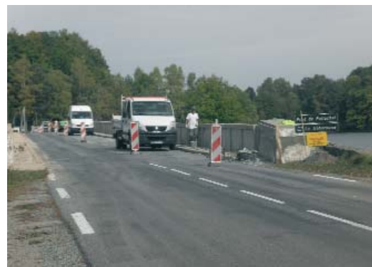
Pont de Pellachal