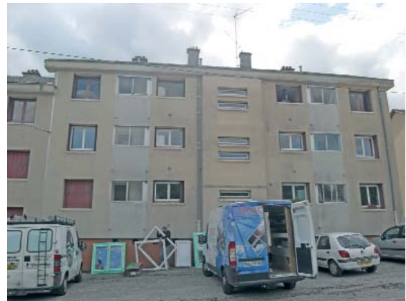
HLM des Ganottes