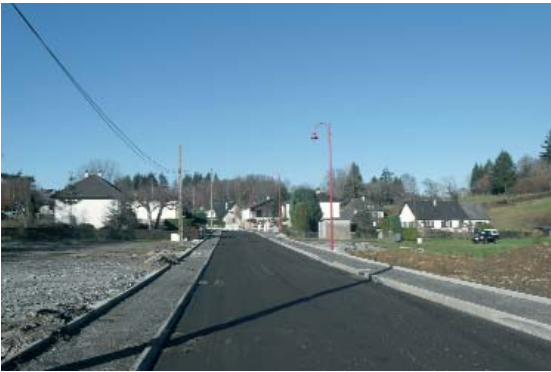
Rue des Ganottes