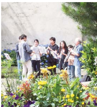
Festiv'académies Aubade en plein air