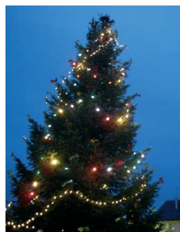
Les illuminations de Noël