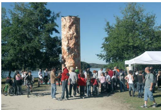
Journée départementale Cap sur les Sports Nature