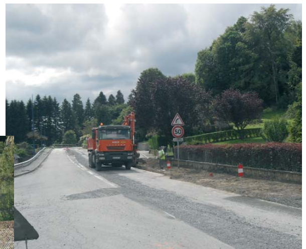
François Hollande et la commission municipale des travaux visitent le chantier Route d'Ussel